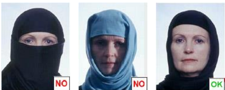
figura 12 bis