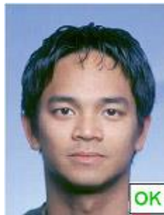
Ombra sullo sfondo